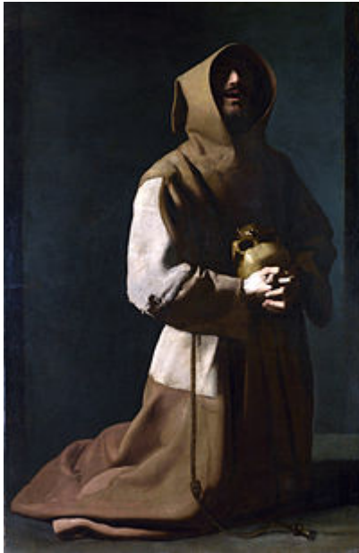
Saint François d'Assise en méditation